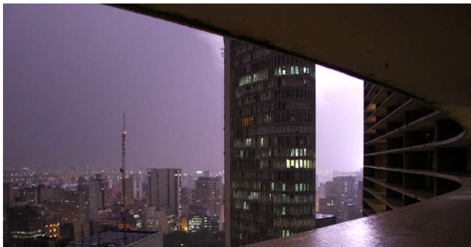
— Tentativa nº 9 —