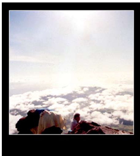
— Tentativa nº 12 —

Não se confunda a minha proposta com o projecto de um relato romântico ou emocionado, na primeira pessoa do singular. A expectativa com que encaro a viagem é conseguir elaborar entre dez a vinte imagens, desenhadas, escritas, cantadas ou faladas, cada uma delas acompanhada por um pequeno comentário descritivo e analítico (seco e duro) que permita compreender o sentido com que observo a Arquitectura da Atlântida, as construções dos seus Atlantes e do modo como habitam o seu mundo. A grande vantagem desse registo é que será o primeiro, liberto de todas as teorias e quiçá, repleto do encanto da primeira vez.