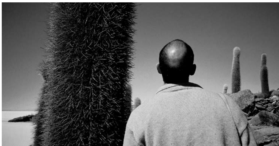
— Tentativa nº 57 —