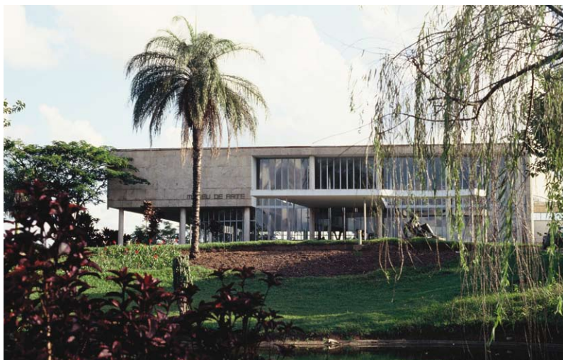
—Casino da Pampulha, Belo Horizonte, 1940–42—

branco, ou revestindo-o com mármore—, construindo formas que tendem sempre à quietude, à leveza, sublimando os grandes esforços estruturais. É por isso que muitos dos seus edifícios parecem não ter história, e, portanto, qualquer rastro de trabalho humano envolvido, sendo muitas vezes chamados de «surrealistas». Como observa Sophia Telles, Niemeyer raciocina a partir da massa dúctil e informe do concreto armado. Isto é: o concreto, para ele, não é um material de acabamento, mas a própria matéria da imaginação , razão pela qual o arquitecto não usa nunca a curva como detalhe caprichoso e ornamental, mas como princípio unificador que constrói a forma em sua integridade . 5