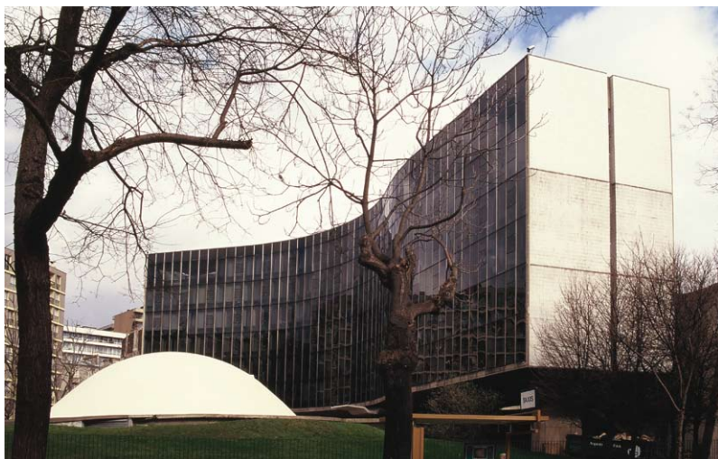
— Sede do Partido Comunista Francês, Paris, 1965–81 —

Como que feitos de argila, no espaço-tempo sonolento do ovo primordial, seus edifícios parecem não ter ainda se desvinculado plenamente da terra, assim como as «figuras reclinadas» de Henry Moore. No entanto, suas formas não estão amalgamadas no mundo indistinto da matéria contínua, como as do escultor inglês. Antes, destacam-se dele pela pureza geométrica, e pela alvura límpida da novidade, na imagem feita por Ferreira Gullar. 6 Recortados na paisagem, mas aderidos ao plano infinito do horizonte, seus edifícios encarnam a ambiguidade da separação moderna entre construção e natureza, oposta à activação espacial coreográfica barroca, que integrava os corpos ao espaço. Nos projectos de Niemeyer, os espaços do entorno são amplos e rarefeitos, quase metafísicos, pois já perderam a capacidade de unificar os sólidos à sua volta. Tido como um arquitecto hedonista, intérprete privilegiado de uma natureza luxurriante, Niemeyer, no entanto, carrega uma intuição trágica e profundamente moderna acerca do destino humano. Mas não a dramatiza. Em sua arquitectura não há esforço, apenas o silêncio do repouso.