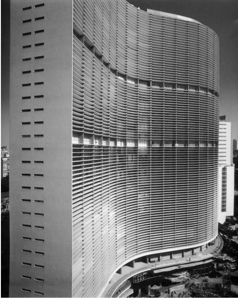
—Edifício Copan, São Paulo, 1951–68—