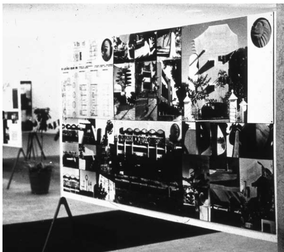
—Painéis de O Leão que Ri de Pancho Guedes na VI Bienal de São Paulo, 1961—

outros arquitectos portugueses. Com a excepção da fábrica da Matola, nos seus projectos essa interpelação nunca é literal e diminui quando se aproxima do Team 10 e ao longo dos anos 60.