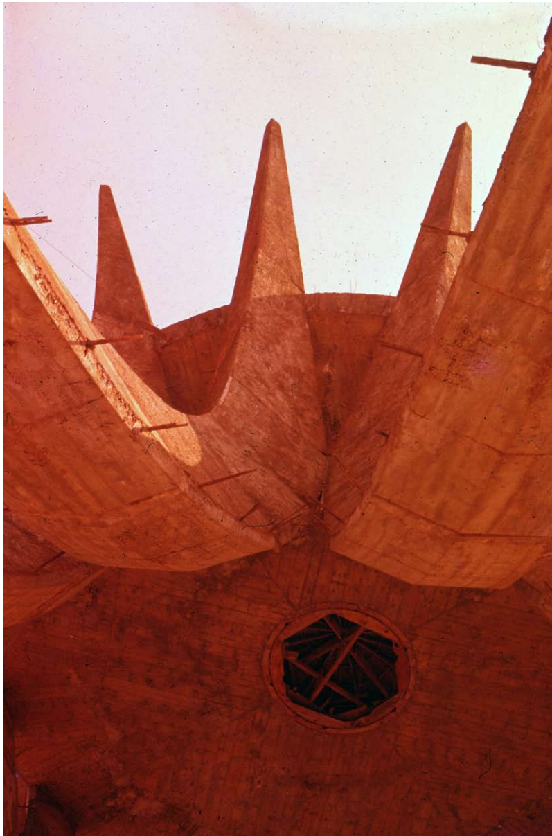
—A Catedral de Brasília fotografada por Pancho Guedes em 1961—