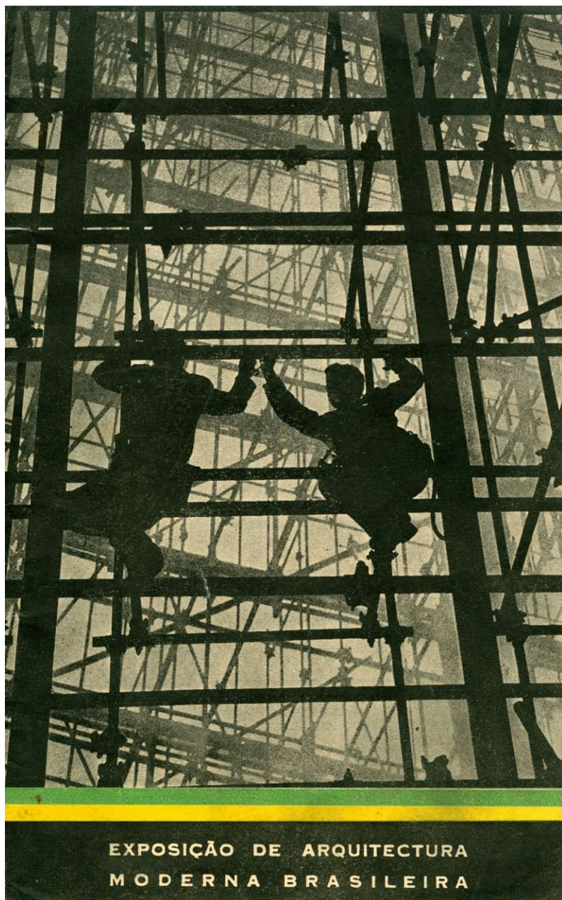
—Capa do catálogo «Arquitetura Moderna Brasileira», Lobito, 1961—